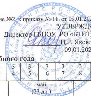
График образовательного процесса на 2 полугодие 2019-2020 учебного года